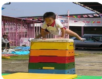
運動会 跳び箱 上手に跳べました