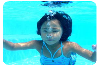
(ウン~パ~)プールの中で 息を上手に吐いています