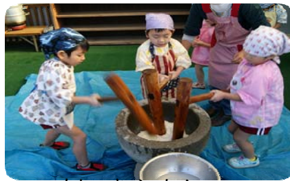
もちつきべったん 頑張れー!