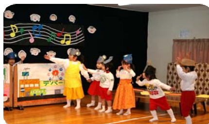
発表会 劇 「いなかのねずみと町のねずみ」