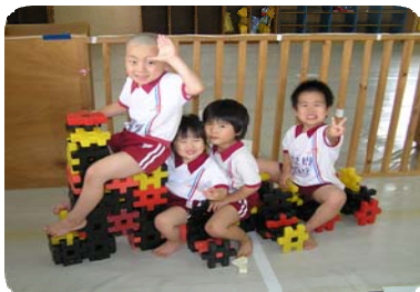
ブロックの汽車ポッポ 出発進行!